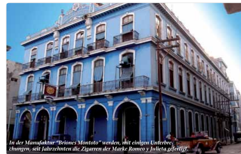
In der Manufaktur "Briones Montoto" werden, mit einigen Unterbrechungen, seit Jahrzehnten die Zigarren der Marke Romeo y Julieta gefertigt.