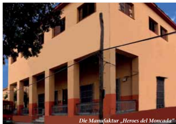
Die Manufaktur „Heroes del Moncada“