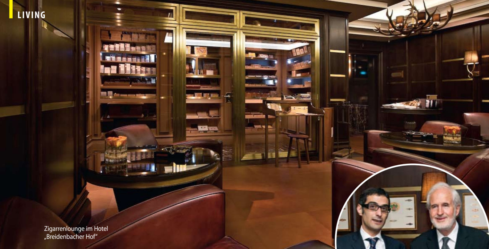
Zigarrenlounge im Hotel „Breidenbacher Hof“