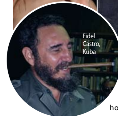
Fidel Castro, Kuba